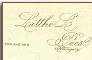
Littke For England pezsgőjének címkéje

Eredményes tárgyalásokat folytatott különböző pécsi befektetőkkel, minek eredményeként 1934. november 29-én létrejött a „Littke Pezsgőgyár Vezérképviselő Kft.”