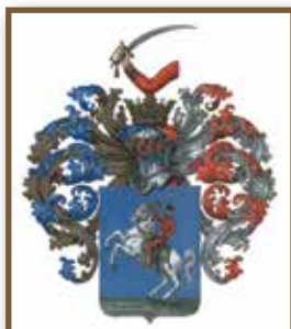
A Littke család címere

1912. április 27. A Littke család magyar nemességet kapott a királytól „Lőrincbányai” előnévvel. (Ezt az előnevet a pécsbányatelepi, egykori Littke tulajdonban lévő szénaknákról kapta a család.)