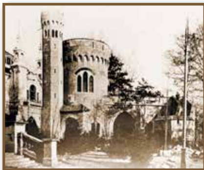
1896. A millenniumi kiállítás Littke pavilonja