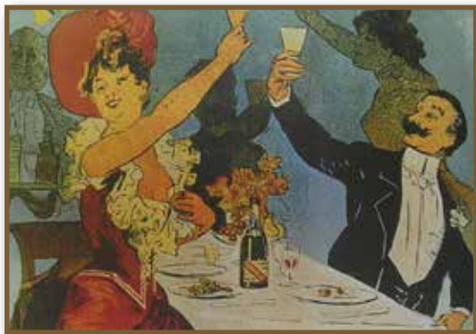
Pezsgő, az orfeumok kedvenc itala

Olyan szempontból sem érdektelen a felsorolást áttekinteni, hogy ebből a vetületből is értékelni tudjuk Littkéék zseniális üzleti érzékét, szakmai tudását.