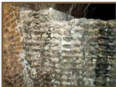
Pezsgők érlelése, tárolása

Tökéletesen hiszem, hogy Littke úr e minden tekintetben pompás és a pécsi házibálok történetében epochát csináló multságért, mellyel pangó tár-