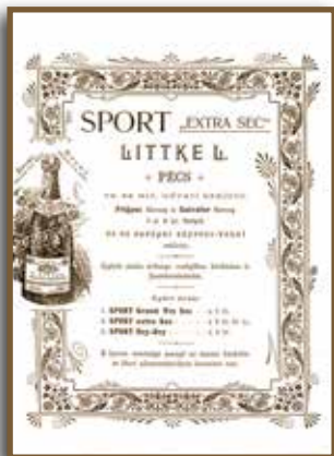
1893. A Littke Sport pezsgő reklámkártyája