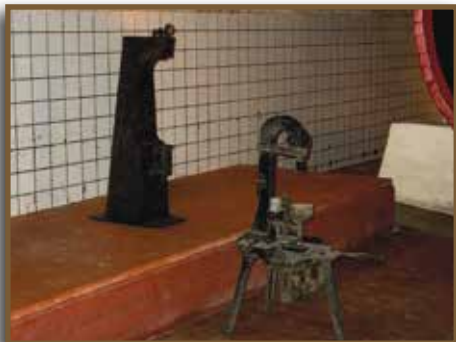
A pezsgőkészítés eszközei 2.