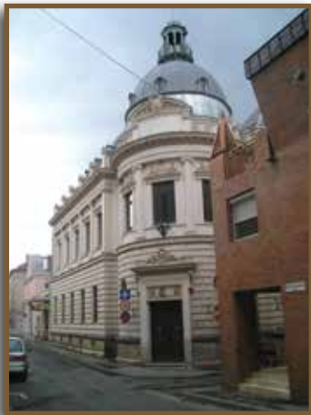
Kereskedelmi és Iparkamara (1893. terv: Kirstein Ágoston)