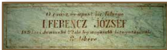
A császári látogatás emléktáblája

1891. június 22-én nagy megtiszteltetés érte Littke József pécsi pezsgőgyárost. I. Ferencz József, „ő császári és apostoli királyi felség” Pécsre látogatása alkalmával látogatásával tisztelte meg üzemét. Kíséretében ott volt Frigyes főherceg és az akkori politikai élet több méltósága is.