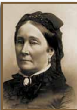
Egy világhírű pezsgő nagyasszonya, Louise Pommery

A pezsgő elterjedését jelentős mértékben elősegítették a napóleoni háborúk. Különben is a háborúk a pezsgőfogyasztást növelték. A szövetkezett hatalmak hadseregei 1814-ben, amikor Franciaországban voltak, átvonultak Champagne-on, és az ottani pezsgók tartalmát nagyon alaposan „tanulmányozták”. A finom italt sokan megismerték, és annyira megkedvelték, hogy a háború befejezése után hazájukban is megkívánták. Ennek hatására hatalmas rendelések keletkeztek Európa-szerte, ami a fogyasztás elterjedését hihetetlen mértékben növelte.