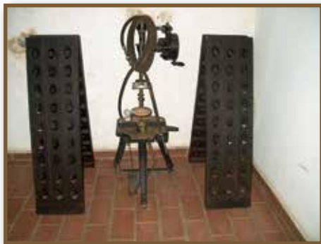
A pezsgőkészítés eszközei 1.

A kezdetek után, 1865-ben a francia módszert kívánták alkalmazni a pezsgőkészítés terén. Sajnos a módszer bevezetése korainak bizonyult. A pécsi adaptáció meglehetősen szerencsétlenül sikerült, melynek során a Littke-társulást jelentős anyagi kár érte.